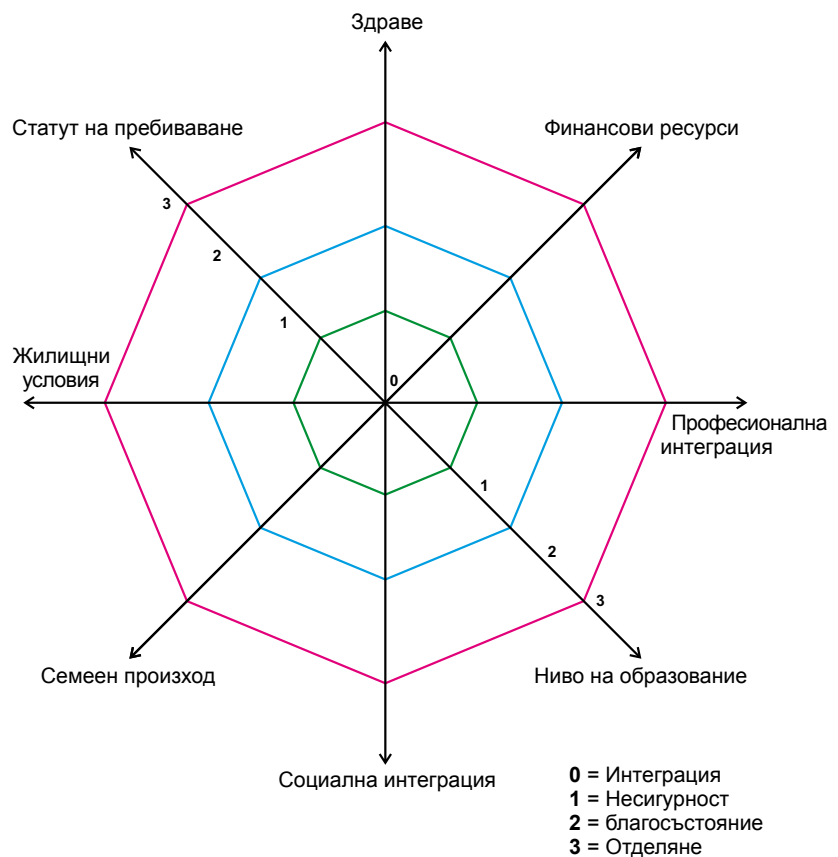
Фигура 2 : Размерите на бедността

Ето защо взимаме под внимание осем измерения. В допълнение към финансовите ресурси, те са: здраве; жилищни условия; ниво на образованието; професионална интеграция; социална интеграция; статут на пребиваване; семеен произход. Ясна представа за тези осем измерения можем да добием от Фигура 2. Съществуват и допълнителни измерения, включително психологически, културни, култови, етични и духовни; те не са анализирани в същата рамка или модел. Тези измерения, обаче, имат не по-малко влияние (а понякога са и най-значими) върху ситуацията, което не е само резултат от материалните измерения в детерминистичния подход 1) .